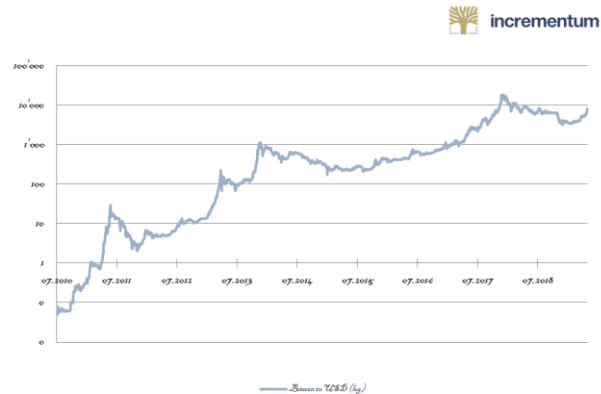
Abbildung 1: Logarithmische Darstellung der Preisentwicklung von Bitcoin

Bitcoin war die erste und ist nach wie vor die populärste Kryptowährung. Darüber hinaus ist sie die wichtigste auf Blockchain Technologie basierende Anwendung.