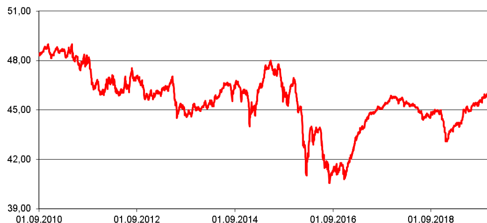
Entwicklung des Fondspreises (in €) Rücknahmepreise - um Ausschüttungen / Thesaurierungen bereinigt

Durchschnittliche Jahreswertentwicklung p. a.: