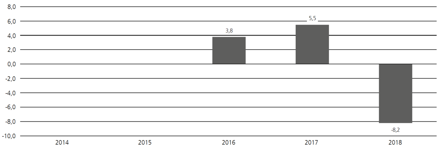
Historische Wertentwicklung Dekamulti Asset Income I (A) (Angabe in %)

Absolute Wertentwicklung vergangener Zeiträume bezogen auf volle Kalenderjahre (Stand 31. Dezember 2018).