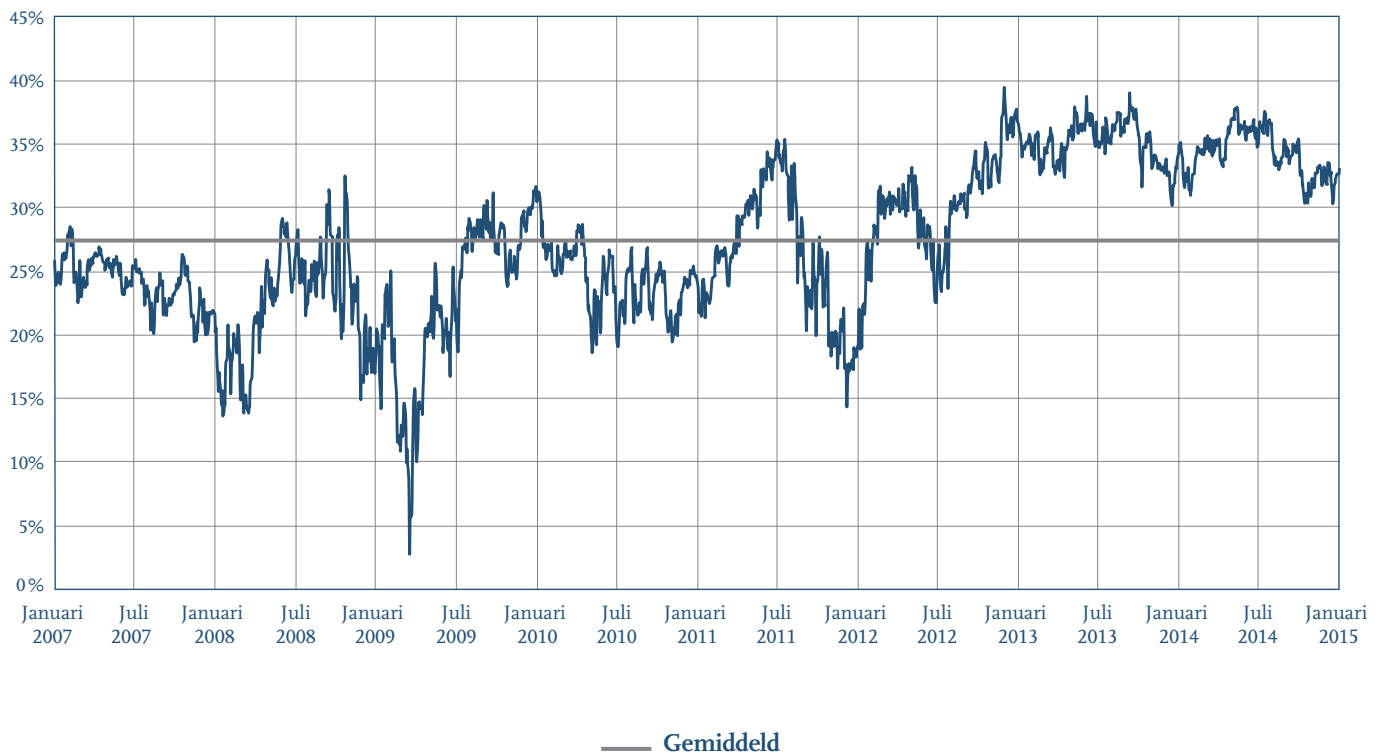
Disagio van Solvac-aandeel tegenover het Solvay-aandeel Grafiek 1.3

De belastingbasis van Solvac behelst 5% van de ontvangen dividenden, minus de - vooral financiële - lasten (schulden aangegaan om een beperkt deel van de aandelenportefeuille van Solvay te financieren), wat verklaart waarom er geen belasting is geheven op het resultaat van Solvac. Solvac ontvangt een brutodividenden-stroom van Solvay. De enige roerende voorheffing die de Solvac-aandeelhouder (rechtstreeks of onrechtstreeks) moet betalen is de voorheffing die Solvac afhoudt bij de uitkering van zijn dividend. Na de harmonisering van het voorheffingstarief op 25% verkeert de Solvac-aandeelhouder in een fiscale situatie die vergelijkbaar is met die van de Solvay-aandeelhouder.