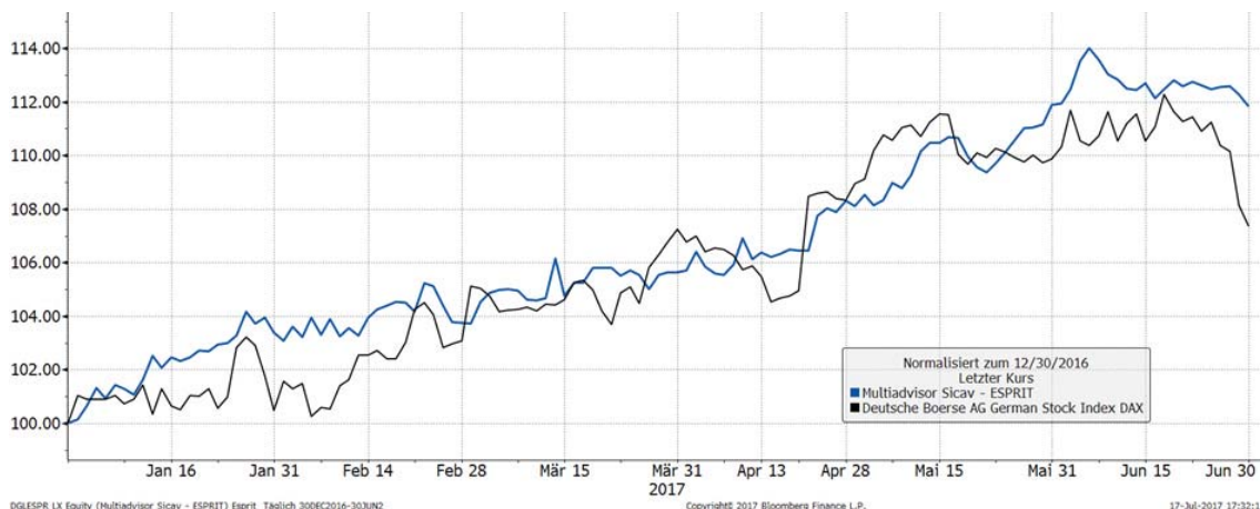
Multiadvisor Sicav - ESPRIT vs. DAX 31.12.16 bis 30.06.17, Quelle Bloomberg

und erzielte so gegenüber dem Markt eine höhere Performance bei gleichzeitig geringerer Schwankungsintensität.