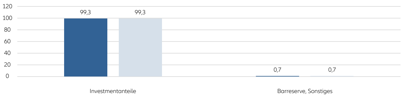
Struktur des Fondsvermögens in %

■ zum Geschäftsjahresanfang ■ zum Berichtsstichtag