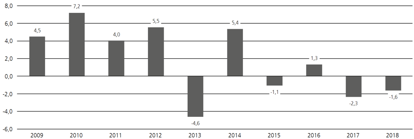
Historische Wertentwicklung Deka-OptiMix Europa CF (Angabe in %)

Absolute Wertentwicklung vergangener Zeiträume bezogen auf volle Kalenderjahre (Stand 31. Dezember 2018).