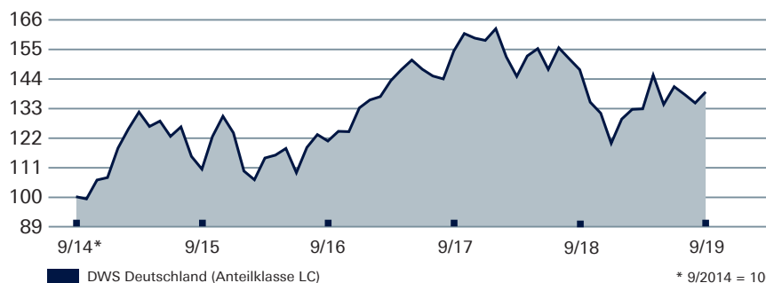
DWS DEUTSCHLAND Wertentwicklung auf 5-Jahres-Sicht

* 9/2014 = 100 Angaben auf Euro-Basis Wertentwicklung nach BVI-Methode, d. h. ohne Berücksichtigung des Ausgabeaufschlages. Wertentwicklungen der Vergangenheit ermöglichen keine Prognose für die Zukunft. Stand: 30.9.2019