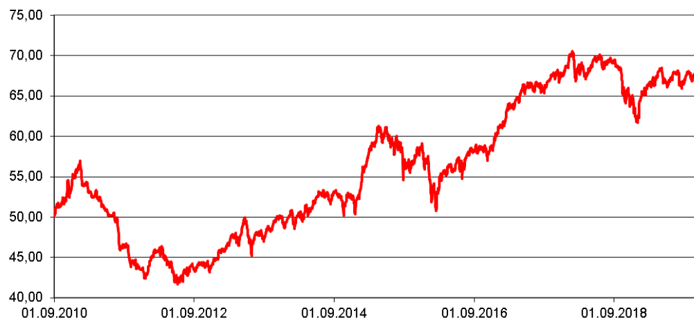
Entwicklung des Fondspreises (in €) Rücknahmepreise - um Ausschüttungen / Thesaurierungen bereinigt

Durchschnittliche Jahreswertentwicklung p. a.: