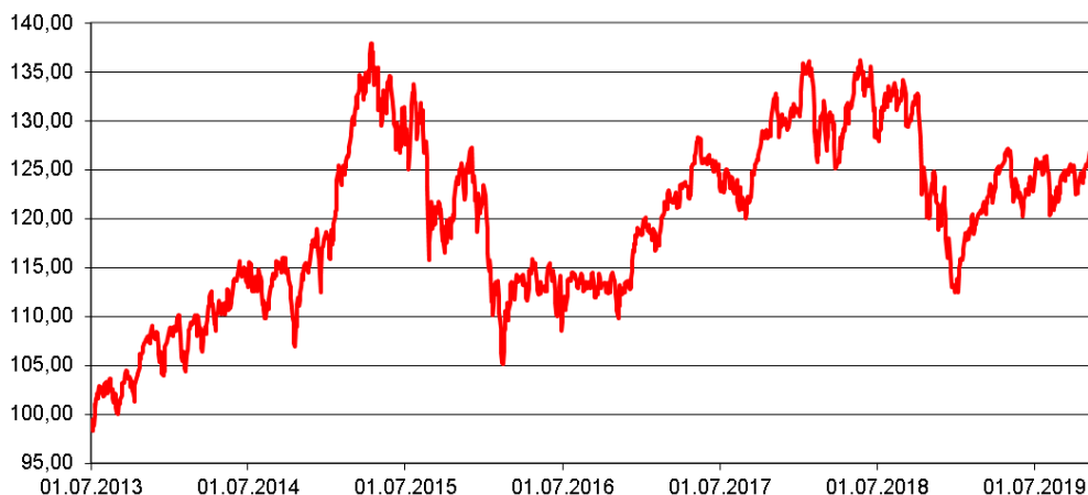
Entwicklung des Fondspreises (in €) Rücknahmepreise - um Ausschüttungen / Thesaurierungen bereinigt

1 Jahr: 6,16 Prozent / 3 Jahre: 4,49 Prozent p. a. / 5 Jahre: 1,91 Prozent p. a. / seit Auflage: 4,21 Prozent p. a